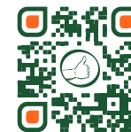
Guapa Supra Winter