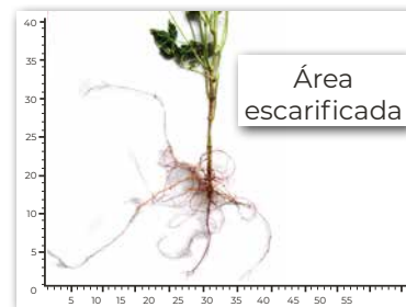
Raíz bien desarrollada